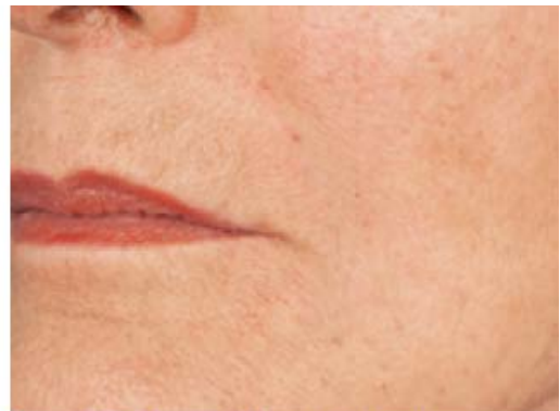
Ergebnis direkt nach Behandlung