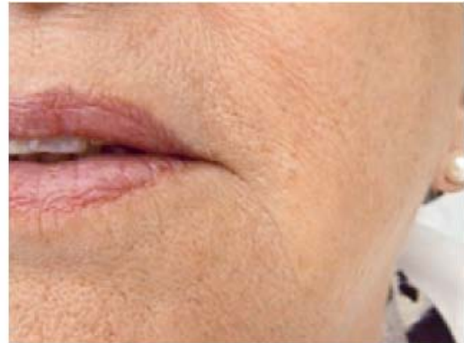
Ergebnis nach 2 Wochen